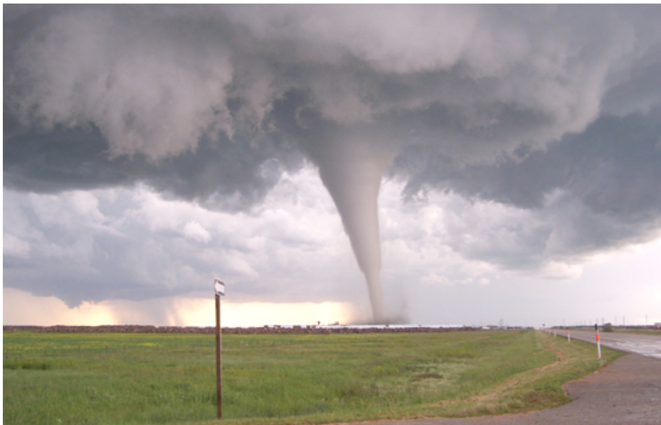
In Midden-Amerika komen veel tornado's voor

Een tornado is een hevige storm. Veel kleiner dan een orkaan, maar wel met sterkere wervelwinden. Een tornado ontstaat als warme, vochtige lucht in botsing komt met koele en droge lucht. Er ontstaat dan een onweerswolk. De warme lucht stijgt op en begint te draaien. Als de winden bovenin versnellen, krijgt de wolk de vorm van een slurf (trechter). De slurf komt dan naar beneden. De meeste tornado's bereiken snelheden van 50 tot wel 450 km per uur. De schade die een tornado veroorzaakt, is vaak erg groot. De schade kan zich verspreiden over breedte van een paar kilometer met een lengte van 100 kilometer.