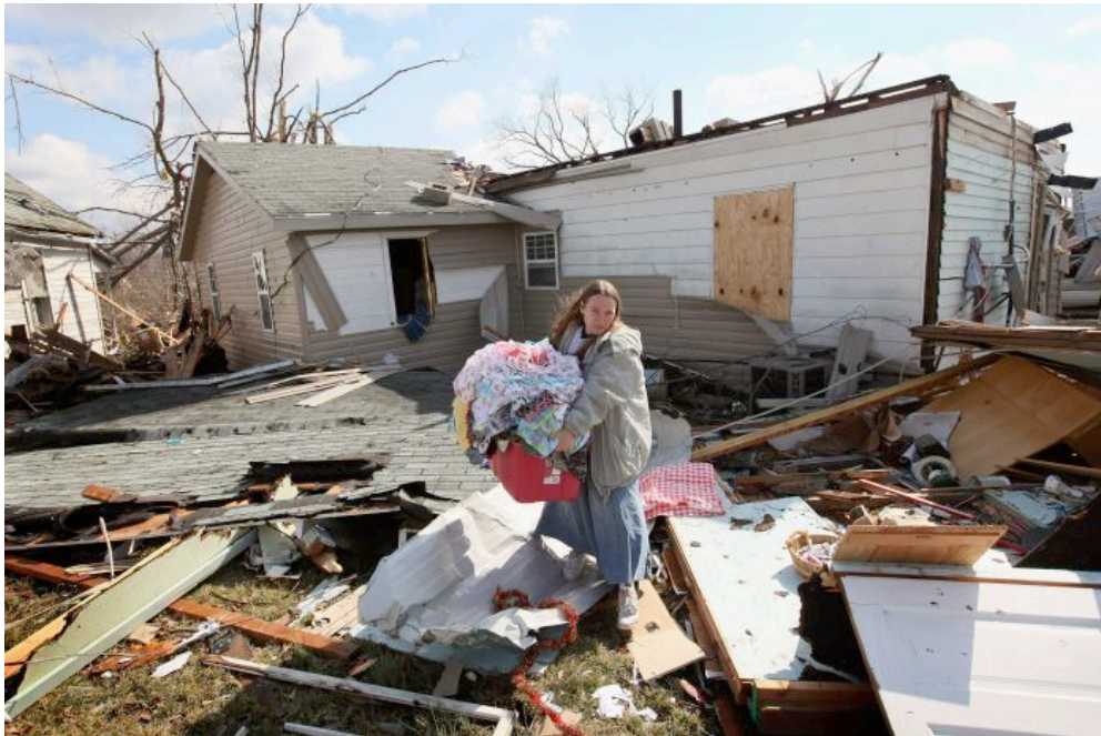
Een tornado kan veel schade veroorzaken